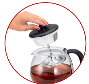
Permanent Edelstahl-Teefilter (herausnehmbar)